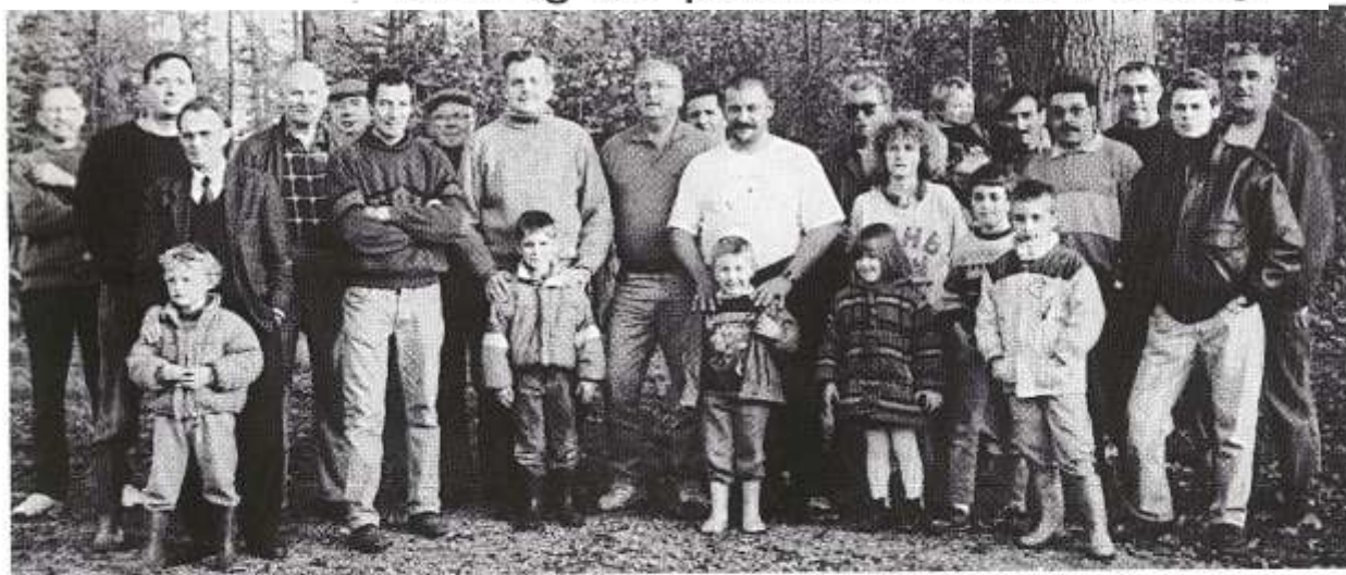
Les pêcheurs réunis pour cette opération.