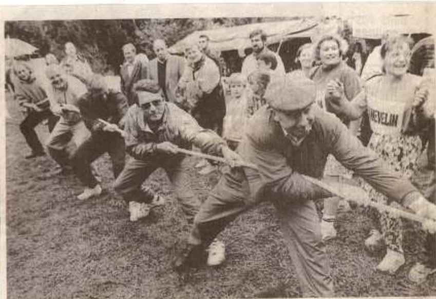
La redoutable épreuve du tir à la corde a permis de départager les ex-aequo.