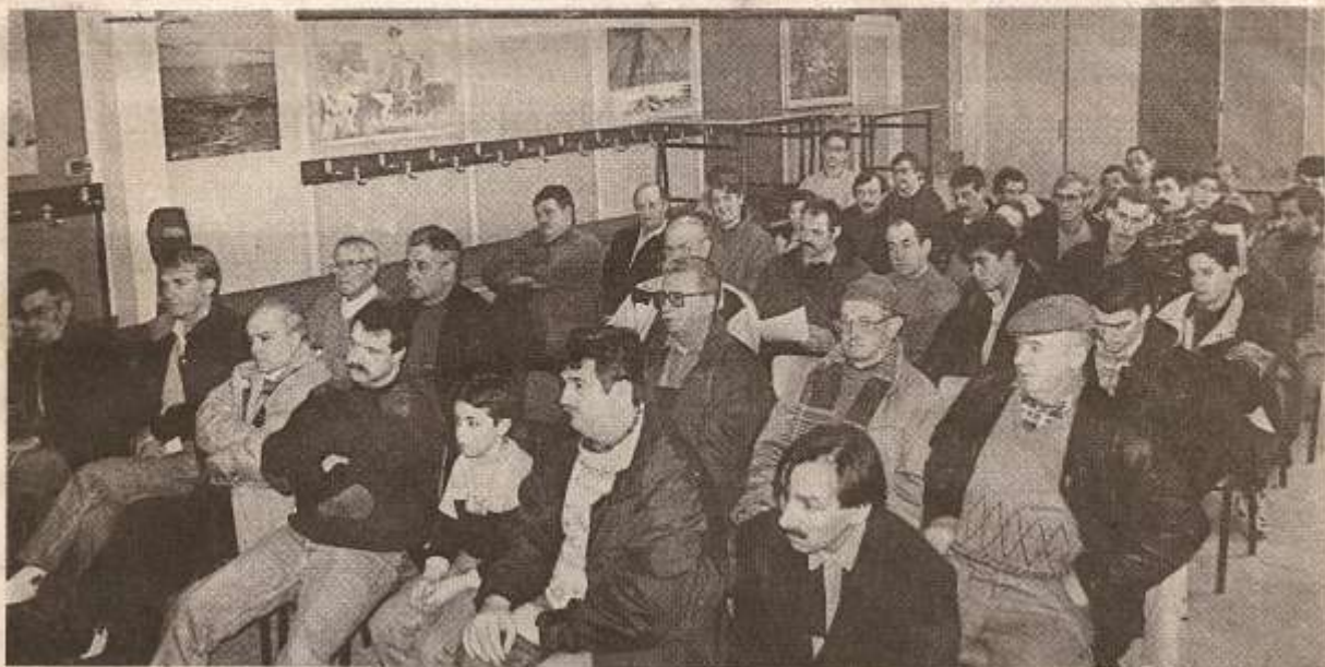
Pêcheurs au repos.