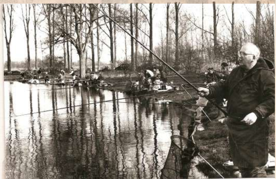
Le président donne l'exemple.

Un petit point noir : les pluies incessantes et les inondations avaient rendu les rives boueuses. Mais cela se stabilisera avec le temps et l'association y veillera. Il faut toutefois signaler que la plupart des pêcheurs sont maintenant équipés de petits pontons individuels autour desquels sont amarrés tous leurs accessoires ; ils peuvent donc s'adon-