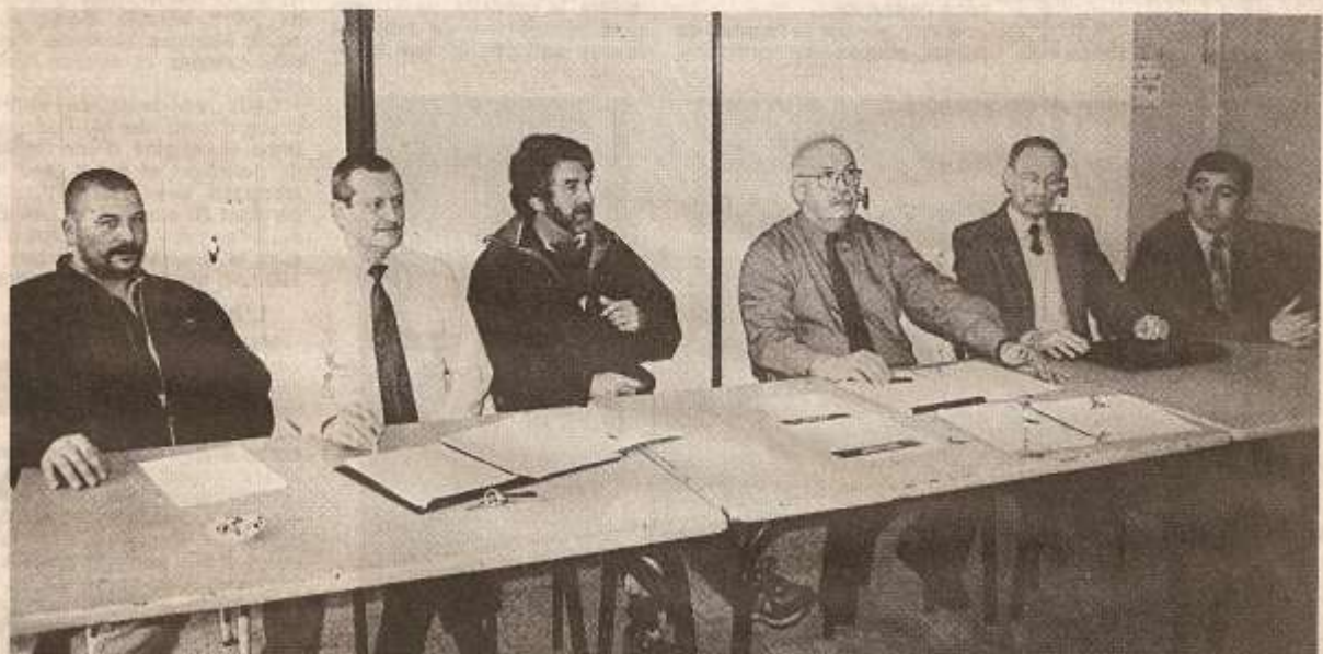
Le bureau encadrant le maire et le président.