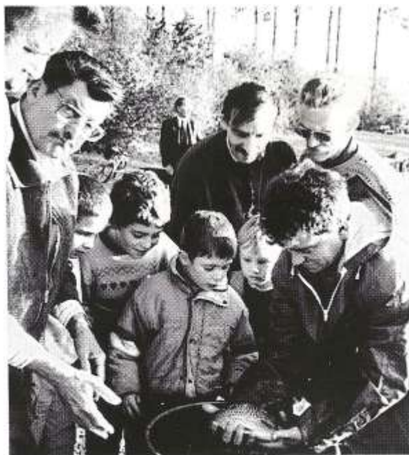
L'avenir : des jeunes pêcheurs et des poissons !