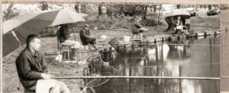
Sous les parapluies

Cet étang regorge de poissons. Entre frayage et réempoissonnement, il y a toute l'année de quoi faire de bonnes prises. Mais, ce dimanche, ils devaient faire la grasse matinée. Et hormis une tanche distante ou gourmande et une libambelle de petits poissons toujours, on ne prit pas grand