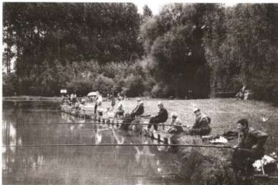
Lors du concours de pêche en septembre