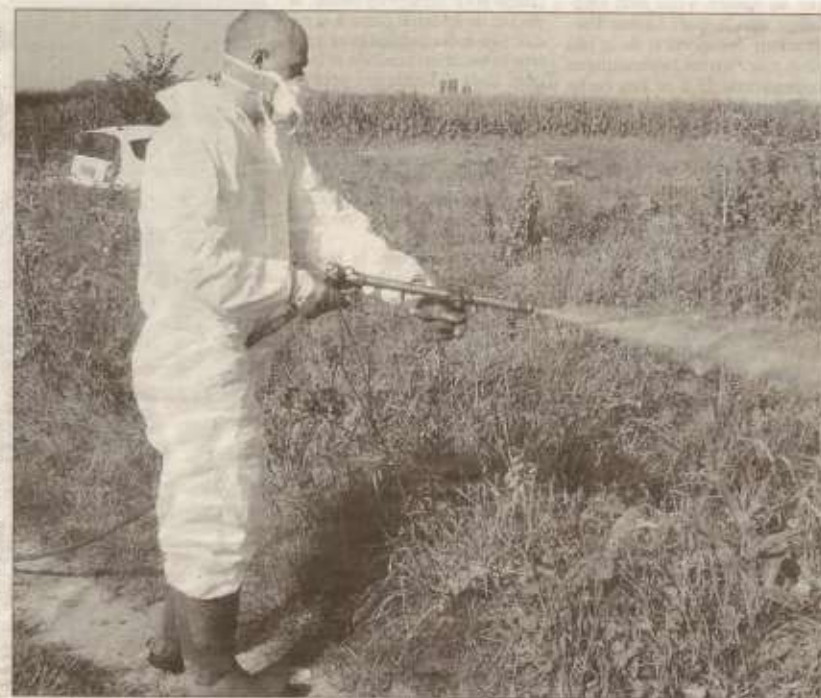
Le plan de bataille est établi : repérer les zones d'habitat du moustique, tuer les larves.

ques, le sang des Pévélois ne fait qu'un tour et, dès les premières années, les élus locaux sont alertés et sollicités pour éradiquer ce fléau. Eux-mêmes avertissent la collectivité compétente dans la lutte : le conseil général.